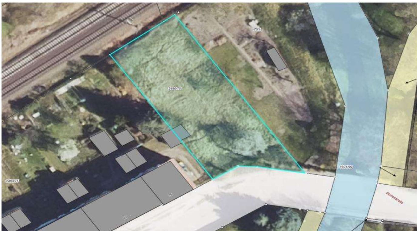
Hegelstraße ca. 890 m 2