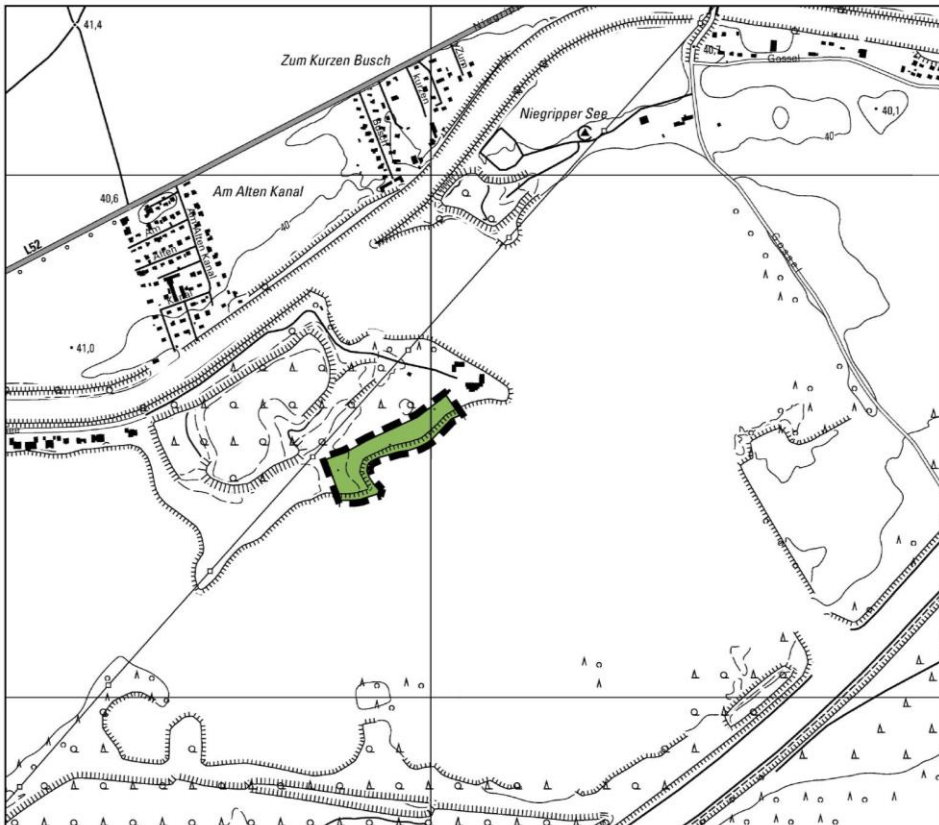
Kartengrundlage: DTK 10/ 2018© LVermGeo LSA / A18/1-3699509