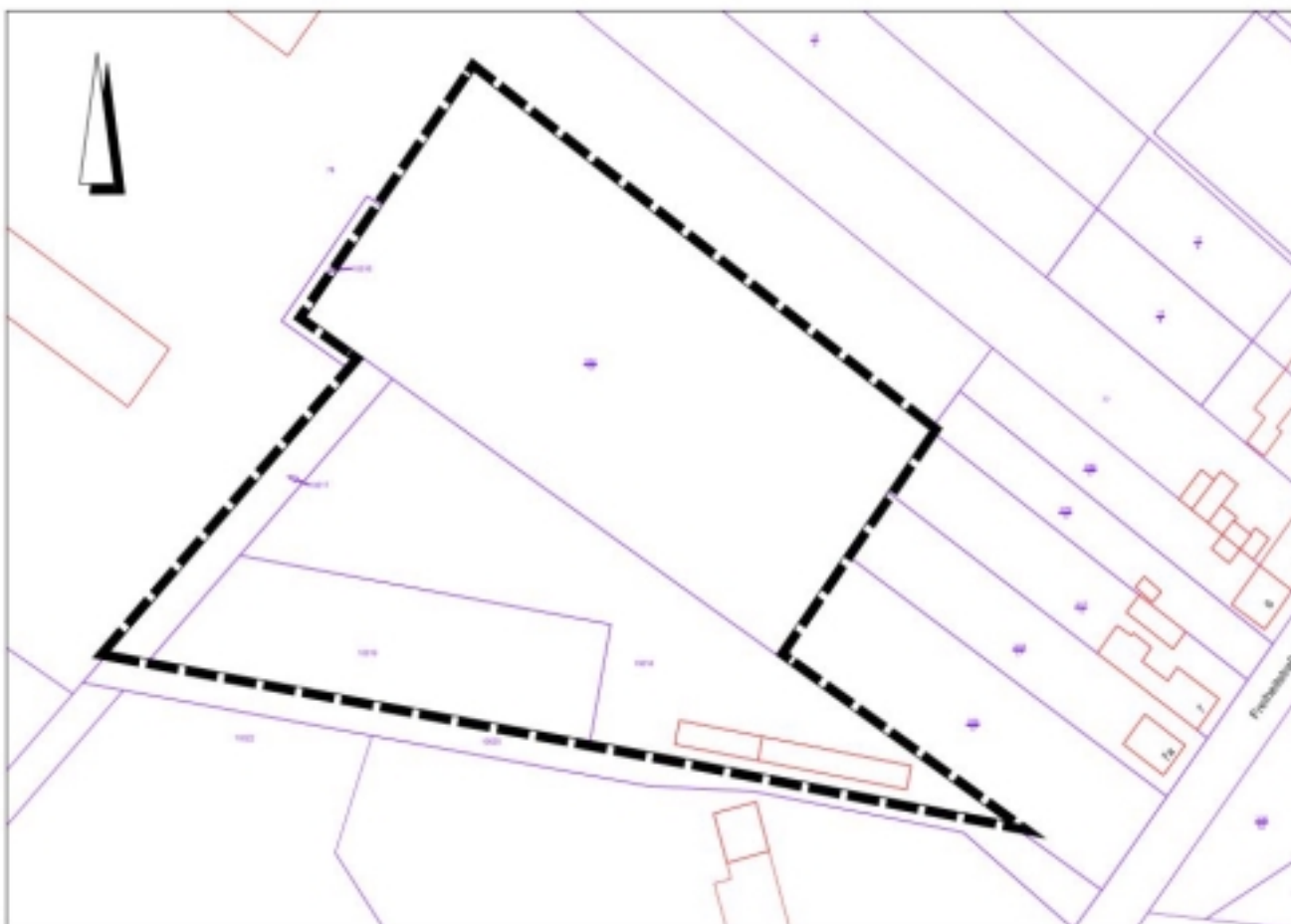
Übersicht über den geplanten räumlichen Geltungsbereich des Bebauungsplanes Nr. 81 „Reithalle Ihleburg“ (Karte unmaßstäblich)