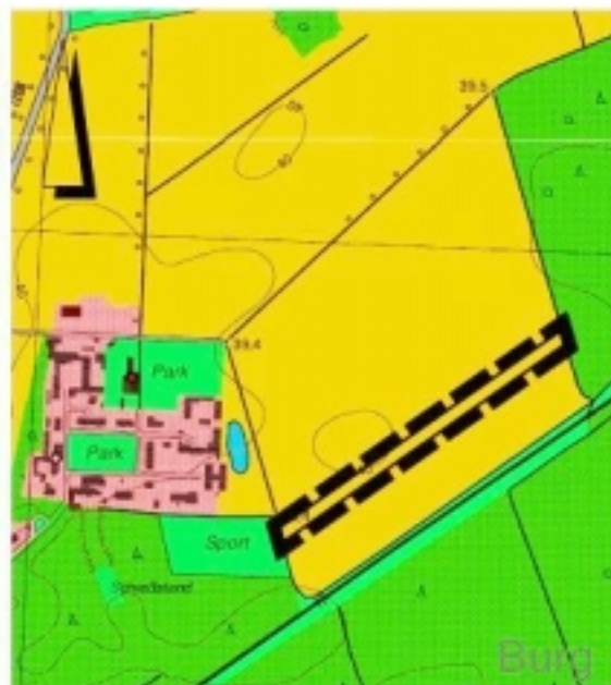
Übersicht über die geplanten räumlichen Geltungsbereiche des Bebauungsplanes Nr. 73 Industrie- und Gewerbepark Burg für die „Erweiterung 4. Bauabschnitt“ (Karte unmaßstäblich)