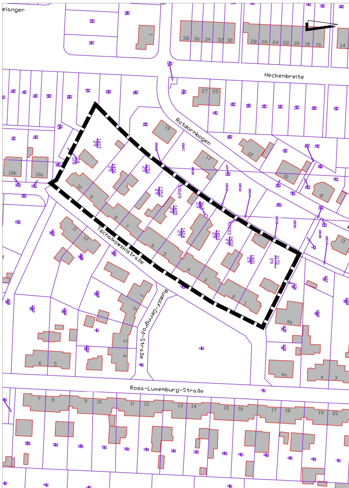
Übersicht über den geplanten räumlichen Geltungsbereich der Aufstellung des Bebauungsplanes Nr. 89 „An der Tschaikowskistraße“ (Karte unmaßstäblich)