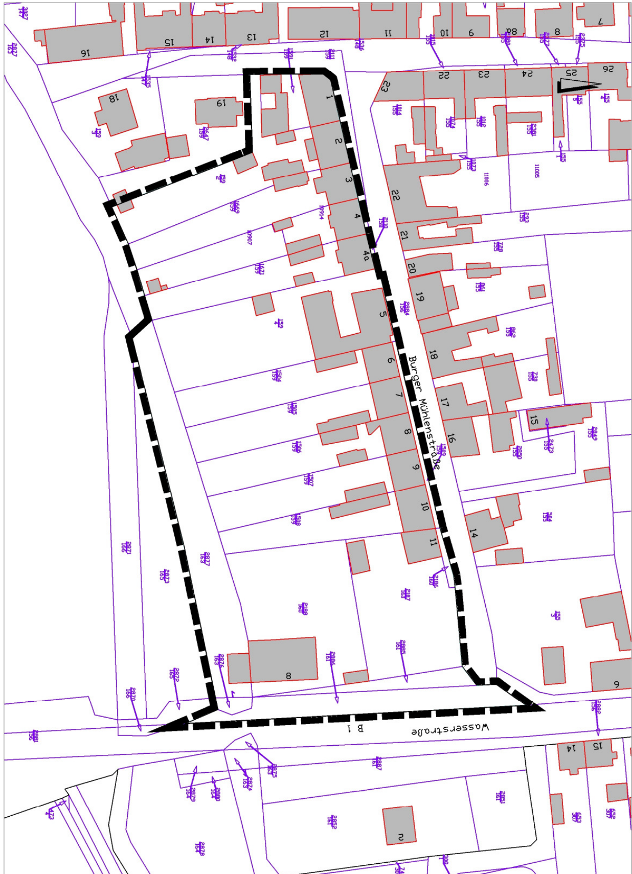
Übersicht über den geplanten räumlichen Geltungsbereich der Aufstellung des Bebauungsplanes Nr. 90 für das Wohngebiet „Wasserstraße/Burger Mühlenstraße“ (Karte unmaßstäblich)