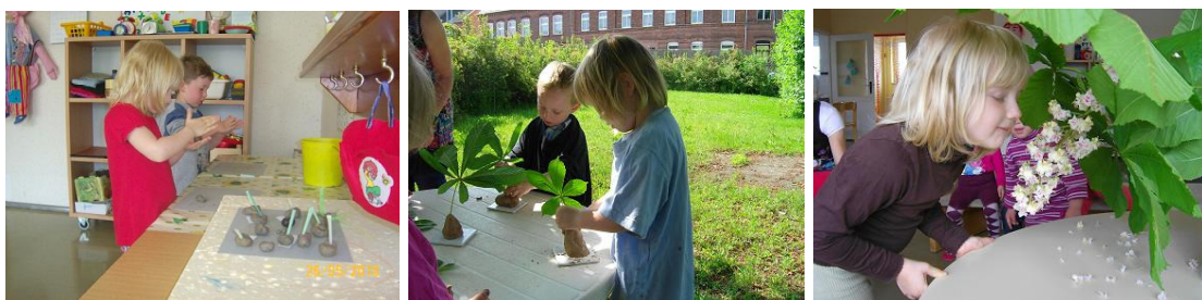
Nachgestalten von Kastanien mit Keimen aus Knetmasse