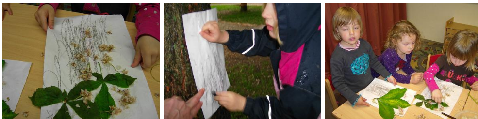
Anfertigen und Gestalten eines Rubbelbildes

Da die alten Kastanienbäume auf dem Spielplatz schon in voller Blüte standen, wurde die Gelegenheit genutzt, um auf die Jahreszeiten einzugehen. Zu welcher Jahreszeit blühen die Bäume? Was sind Merkmale des Frühlings? Blüten wurden betrachtet, gefühlt und Farben verglichen. „Die Blüten riechen!“, stellte ein Mädchen fest. Die Kinder entdeckten Kastanienbäume auf dem Spielplatz mit weißen und rosa Blüten. Zusätzlich rückte eine Raupe auf dem Kastanienblatt ins Geschehen. Obwohl in der Planung nicht vorgesehen, entstand daraus eine neue Idee. Die Geschichte der Raupe „Nimmersatt“. Die Raupe wurde durch einen mit Farbe bemalten Korken auf ein Blatt getupft und gestaltet.