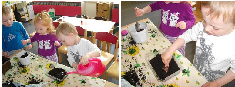
Einpflanzen der Kastanienkeime