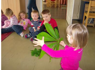
Zählen der Blätter

gaben sie sich beim Gießen der Pflanzen Mühe, um keinen Tropfen des kostbaren Wassers zu verschütten. Am Ende des Projektes ordneten die Kinder Fotos über die Entwicklungsphasen des Keims der entsprechenden Zahlen 1 bis 4 zu.