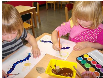
Entdecken der „kleinen Raupe Nimmersatt“ und anschließendem Stempeln einer Raupe mit Farbe und Kork