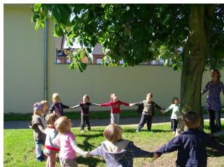
Kreis- und Bewegungsspiele

Zwei Beobachtungsgänge wurden unter dem Motto: „Wir suchen Kastanienbäume in unserer Stadt“ durchgeführt. Auch hier waren die Kenntnisse der Kinder und Eltern gefragt. Beim Spaziergang am Wochenende animierten die Kinder ihre Eltern, die Orte der Kastanienbäume zu erkunden. Im Stadtpark wurde der dickste Kastanienbaum entdeckt. Es ist schön zu sehen, dass bei den nachfolgenden Ausflügen in Stadt und Umgebung eine Vielzahl von Kindern den Kastanienbaum schon aus der Ferne erkennen und richtig bezeichnen.