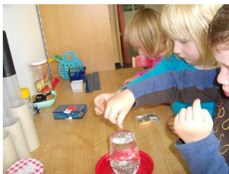
Wasserexperiment – Ein Wasserberg entsteht