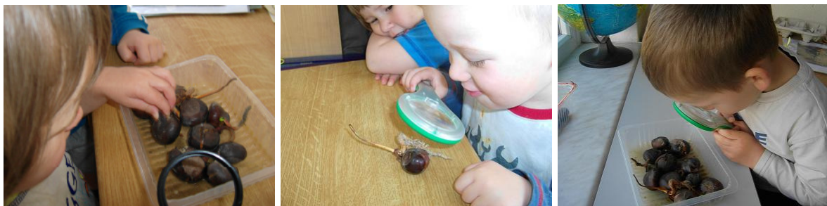
Die Kinder beim Betrachten der Keime.

Die Kinder hatten unterschiedliche Vorschläge. Einige wollten das Gewächs auf den Spielplatz einpflanzen, andere Kinder wollten das Bäumchen mit nach Hause nehmen oder verschenken. Da unser Freigelände bereits über mehrere Kastanienbäume verfügt, mussten wir uns mit den Kindern einigen, dass wir dort nur einen Baum pflanzen. Ein Bäumchen wurde mit zum Pflegeheim genommen, als Andenken an unsere langjährige Patenschaft. Die anderen wurden bei unserm geplanten Kinder- und Familienfest unter den Kastanienbäumen des Spielgeländes in der Tombola als Preise angeboten. Dies war der Höhepunkt und Abschluss des Projektes. Stolz präsentierten die Kinder dort ihre Kastanienbaumzuchtung.