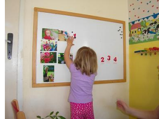
Zuordnungen der Entwicklungsphasen der Kastanienkeime