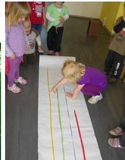
Ermitteln und Vergleichen des Umfangs von Kastanienbaumstämmen