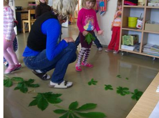
Vergleichen und Sortieren nach Größe