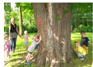
Der dickste Kastanienbaum der Stadt