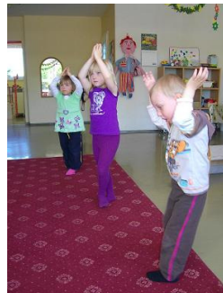
Yoga-Übung „Der Baum“