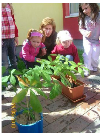
Vergleichen des Wachstums der Pflanzen