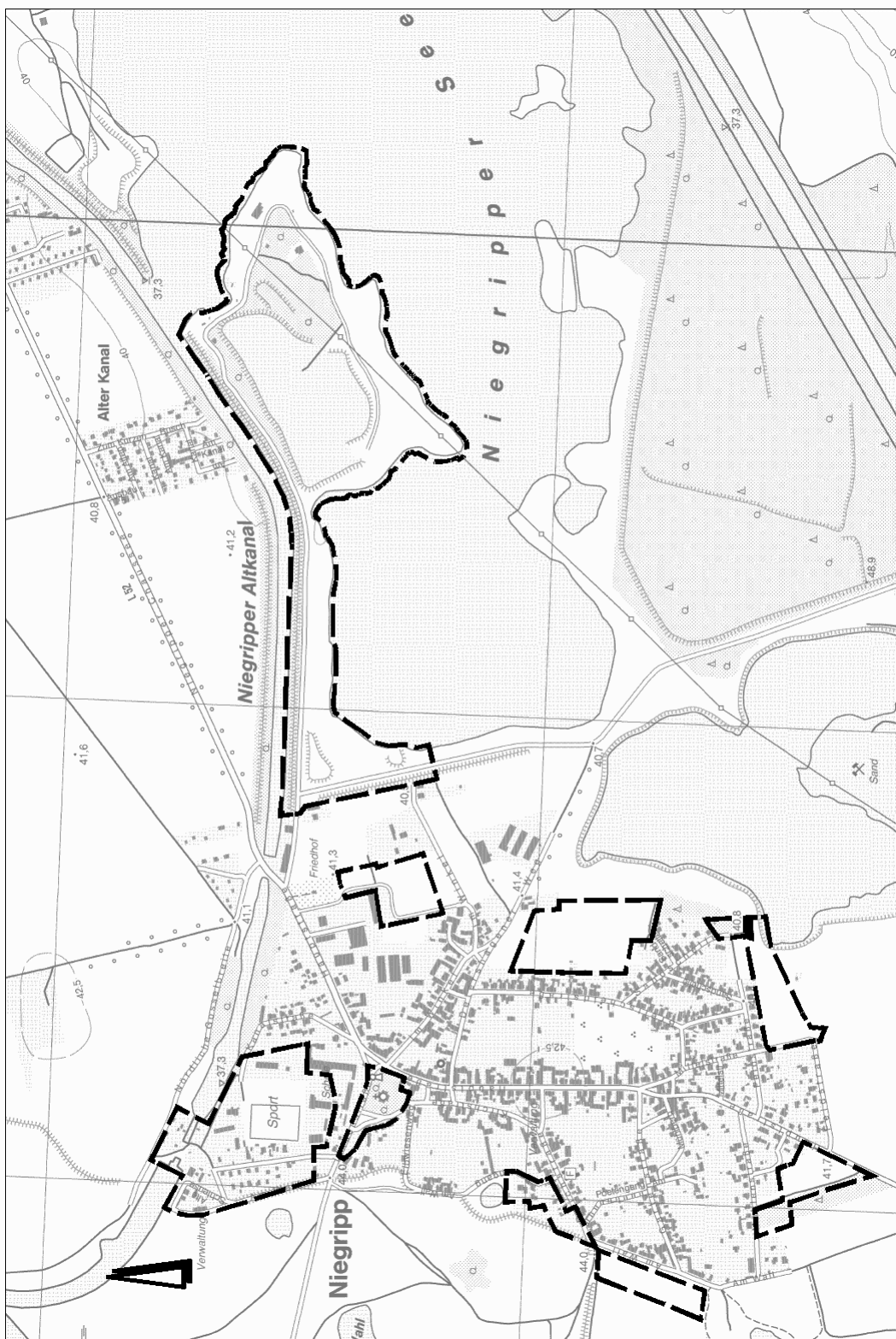
Übersicht über den geplanten räumlichen Geltungsbereich zum Änderungsverfahren des Teilflächennutzungsplanes Niegripp und des Flächennutzungsplanes Burg für den Bereich „Niegripper See/Ortslage Niegripp“ (Karte unmaßstäblich)