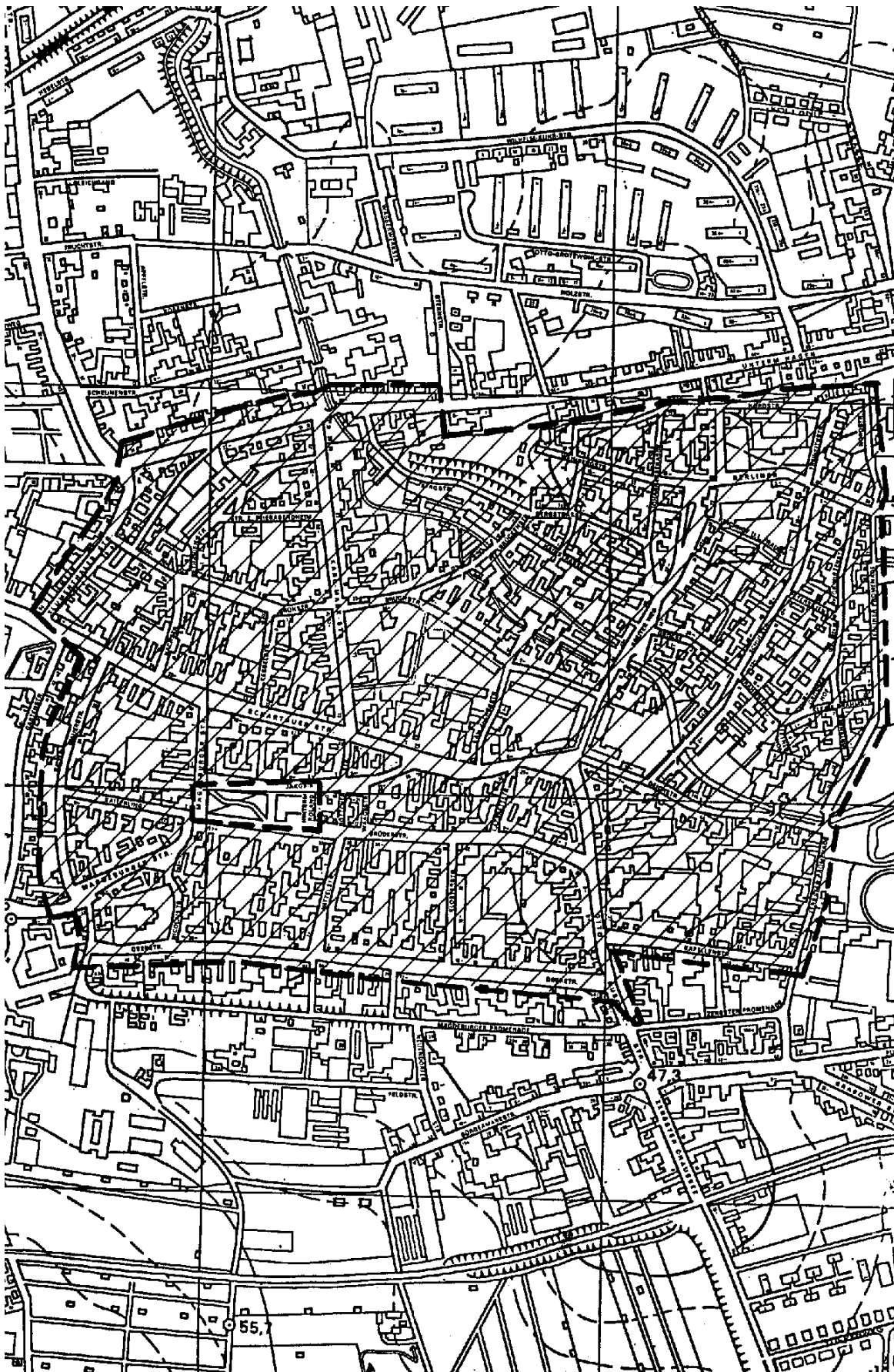
Übersicht über den geplanten räumlichen Geltungsbereich über die Änderung der Gestaltungssatzung „Innenstadt Burg“ (Karte unmaßstäblich)