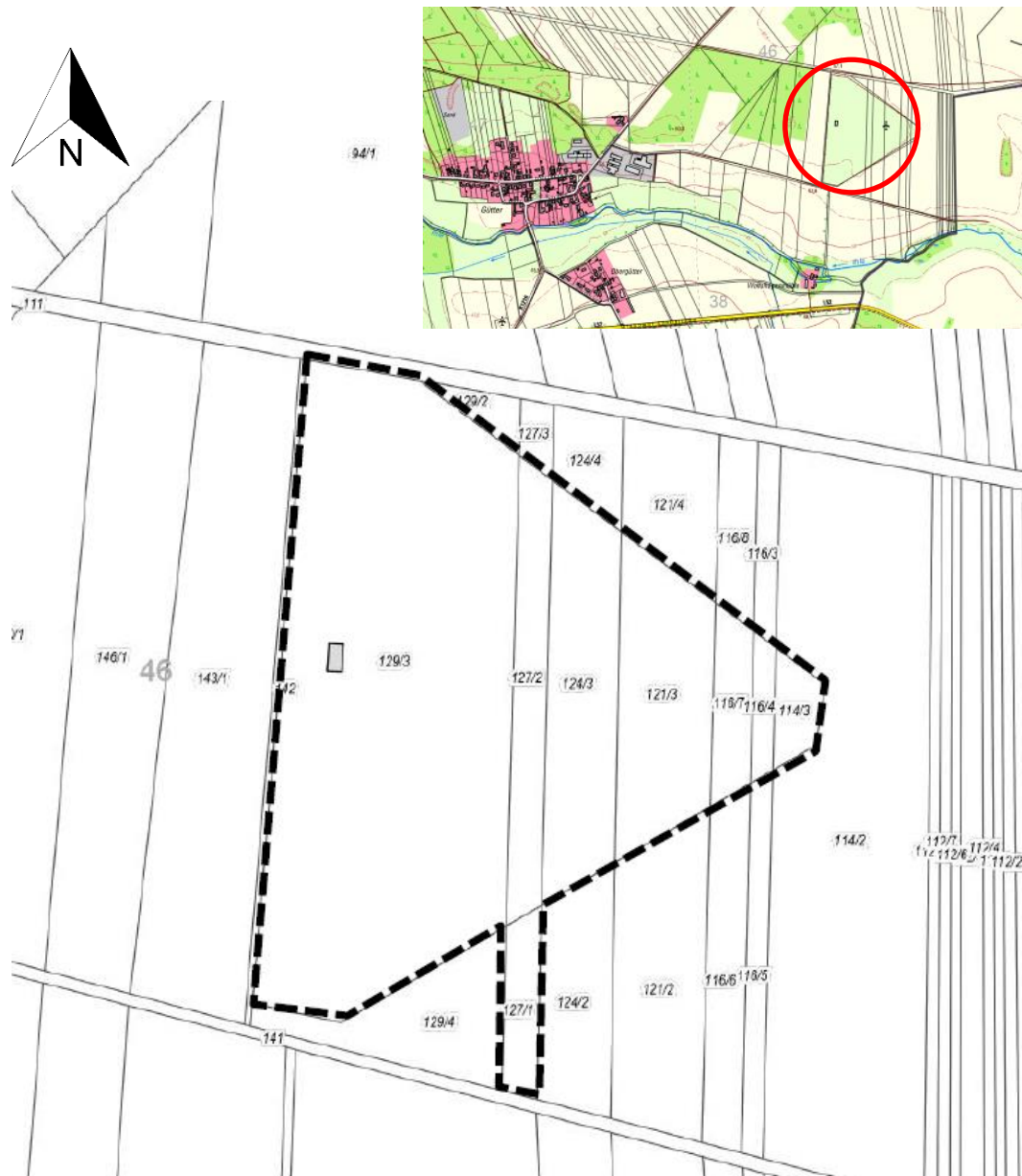
Abbildung mit Lage des geplanten räumlichen Geltungsbereichs des Bebauungsplanes Nr. 117 Sondergebiet „Solarpark östlich von Gütter“. -Kartenauszug unmaßstäblich-