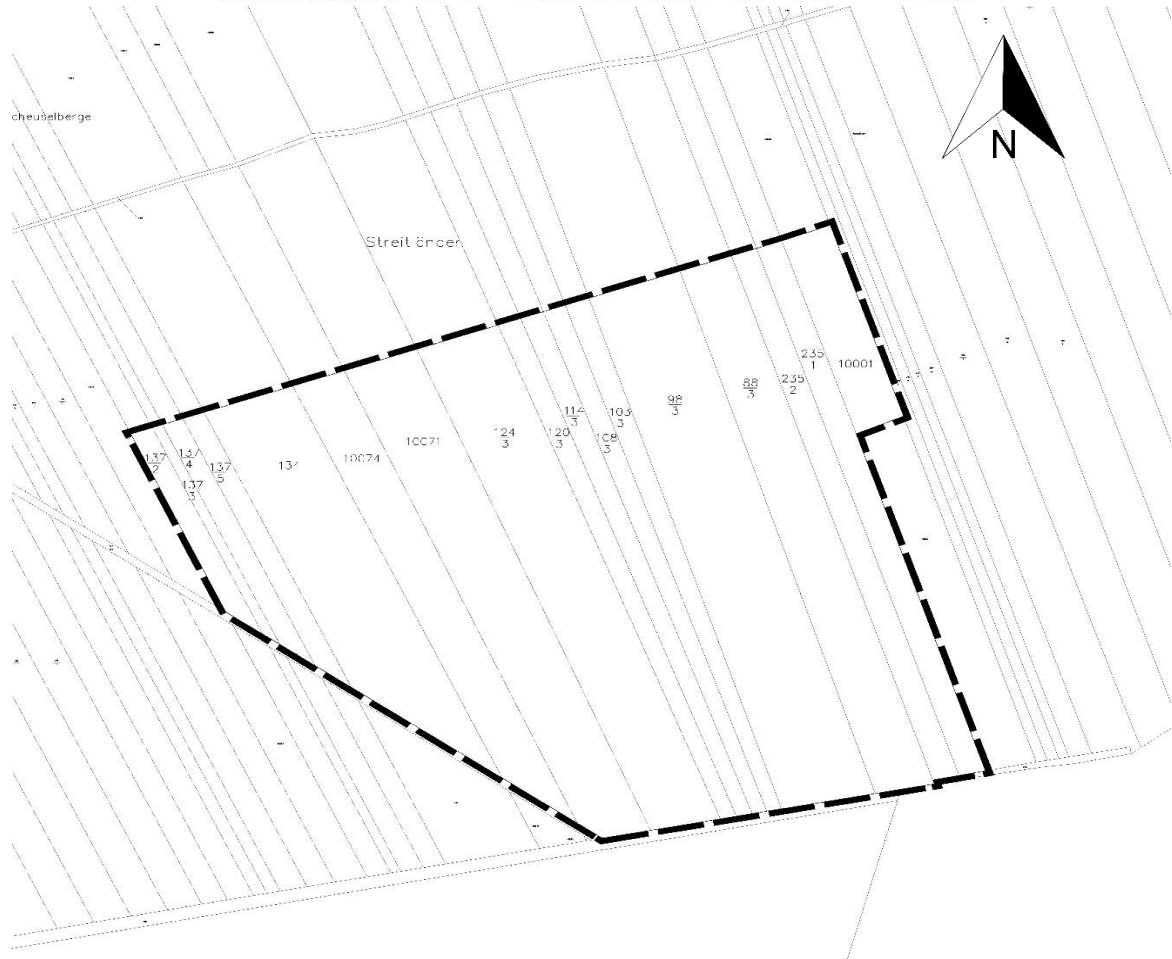
Abbildung mit Lage des geplanten räumlichen Geltungsbereichs des Bebauungsplanes Nr.119 am Gewerbestandort Am Reesener Triftweg für eine Photovoltaik-Freiflächenanlage im Projekt "Energie zu Gas" in der Ortschaft Reesen. -Kartenauszug unmaßstäblich-